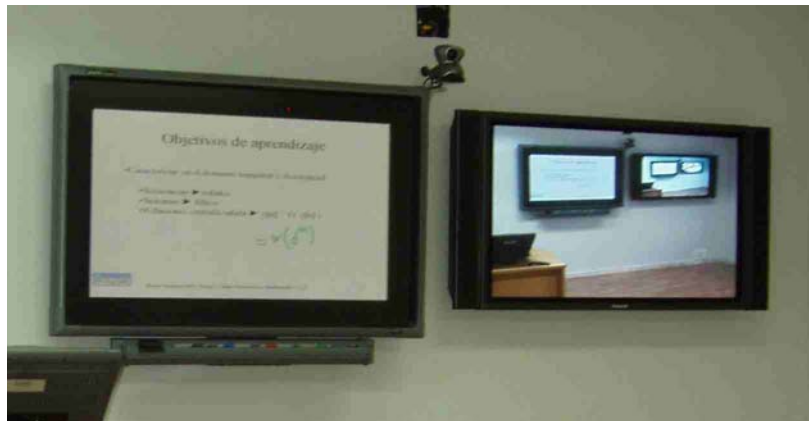
A la izquierda pantalla del smartboard, a la derecha pantalla con altavoces

1-b.- Pantalla con altavoces: Encender con la tecla ON. Esto debe ser suficiente, pero si está desconfigurada la entrada basta con pulsar la tecla INPUT hasta que la entrada "Input 1B" quede seleccionada.