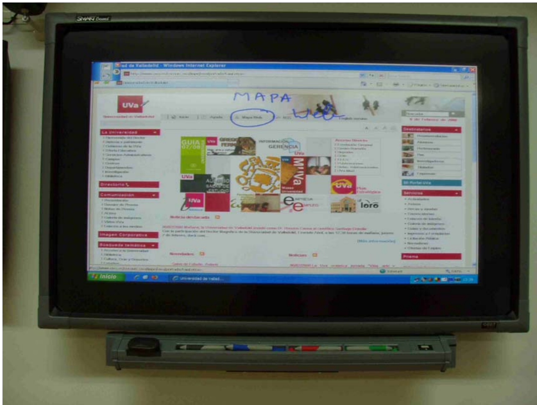
Pizarra electrónica o smartboard