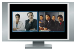
Imagen local y remota, igual tamaño, una al lado de la otra.