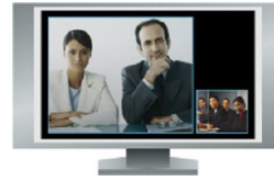
Imagen remota grande, imagen local en pequeño

Imagen local y remota, igual tamaño, una al lado de la otra.