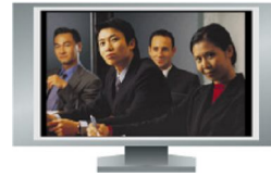
Imagen local a pantalla completa

Imagen local grande, imagen remota en pequeño