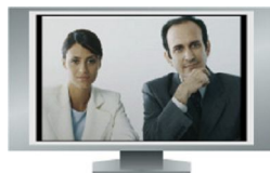
Imagen remota a pantalla completa