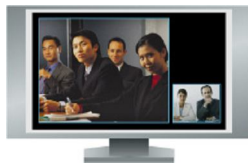
Imagen local grande, imagen remota en pequeño

Imagen remota grande, imagen local en pequeño